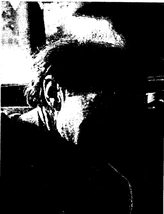
Ernst Wiechert in der Schweiz

Ernst Wiechert, 18. Mai 1887 – 24. August 1950, deutscher Dichter aus Ostpreussen, lebte von 1948 bis zu seinem Tod 1950 in Stäfa am Zürichsee. Er zählt zu den Klassikern der deutschen Literatur in der ersten Hälfte des 20. Jahrhunderts und war einer der meistgelesenen deutschen Autoren.