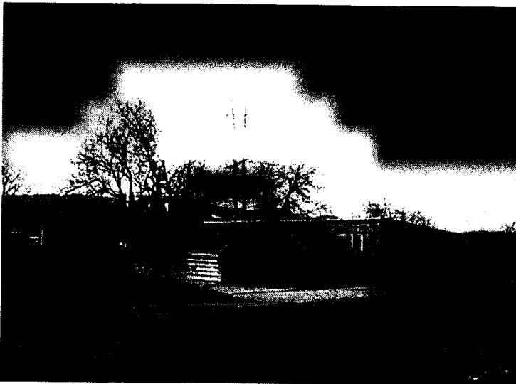
Rüthhof in Uerikon heute

Nach Ernst Wiechert sind in Deutschland zahlreiche Strassen, Plätze und Wege benannt, so in Fellbach, Mönchengladbach, Cottbus, Münster, Bochum, Dortmund, Salzgitter, Ludwigsburg, Regensburg, Celle und Ulm – um nur einige zu nennen.