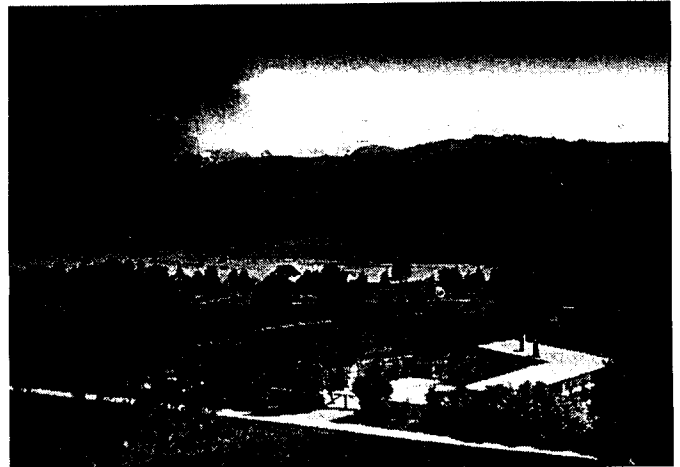
Rütihof Uerikon-Stäfa zur Zeit Wiecherts 1950

Dazu gehörten auch die in Zürich gehaltene Rede an die Schweizer Freunde (1947), sowie die Rede Das zerstörte Menschengesicht an der Goethe-Feier in der Kirche von Stäfa vom 22. September 1947.